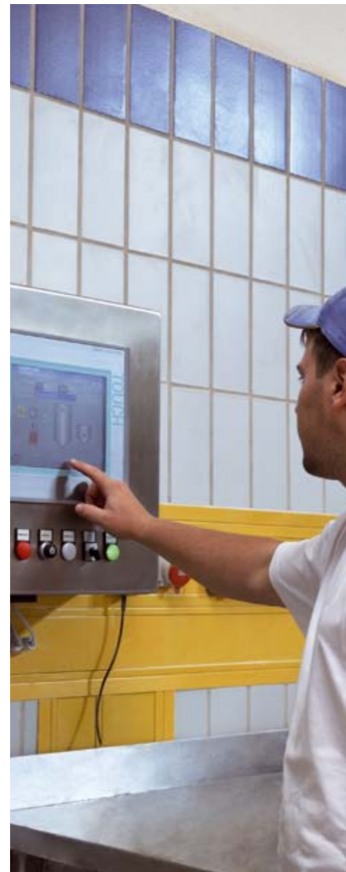
MINT 99 im Einsatz

Zeppelin Reimelt bietet für das Bäckerhandwerk, den Mittelstand und die Industrie Steuerungstechnik ganz nach Bedarf: von der einfachen Verwiegung bis zur vollautomatisierten Produktion mit Web-Technologie. Die einzelnen Systeme können jederzeit auf- und nachgerüstet werden und sind miteinander kombinierbar – für die individuelle Konfiguration Ihrer Betriebsabläufe. Und weil die Software auch nach vielen Jahren noch von unserem Team gewartet wird, genießen Sie ein hohes Maß an Investitionssicherheit.