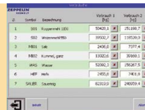
Monats- und Quartalsverbräuche